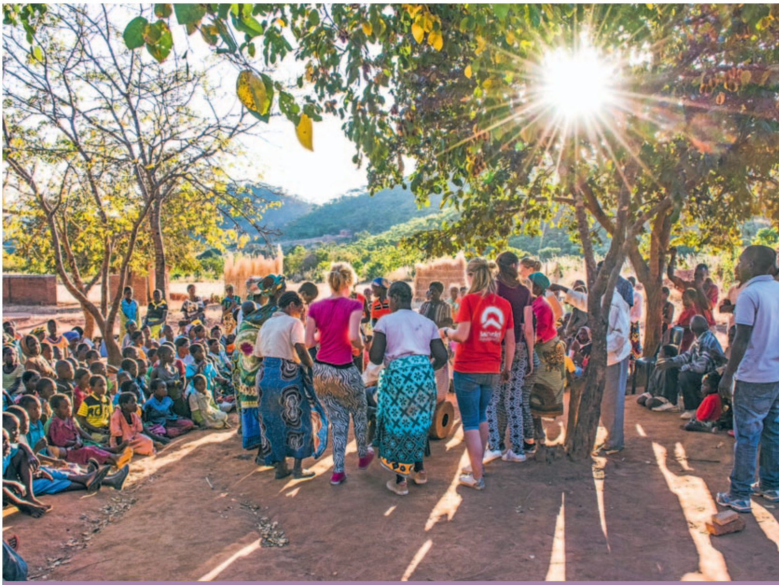
Het contact met de lokale bevolking heeft veel invloed op het geloof van jonge vrijwilligers.

Uit het onderzoek blijkt ook dat geloof meer voor de jongeren betekent nadat ze een vrijwilligersreis hebben gemaakt. Het contact met de lokale bevolking heeft daarop veel invloed, zegt Elzinga. 'Ze komen in contact met de geloofsbeleving van de mensen in Afrika of Zuid-Amerika. Dat is vaak een heel pure manier van geloven, waarbij veel vertrouwen komt kijken. De mensen daar hebben in